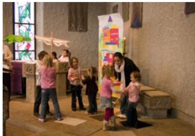
Die Leute aus Ninive

So jedenfalls konnten es die vielen großen und kleinen Gottesdienstbesucher beim Familiengottesdienst am 11. März erleben, als der Kindergarten der Thomasgemeinde die Geschichte von Jona aufführte. Mit von der Partie waren natürlich auch das Schiff