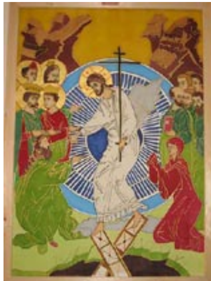
Seiden-Ikone "Christi Auferstehung"

noch etwas anderes kommt als der Zerfall zu Erde oder Asche, das wissen wir nicht. Jedenfalls wissen wir es nicht mit der Art von Sicherheit, mit der wir wissenschaftlich erforschbare