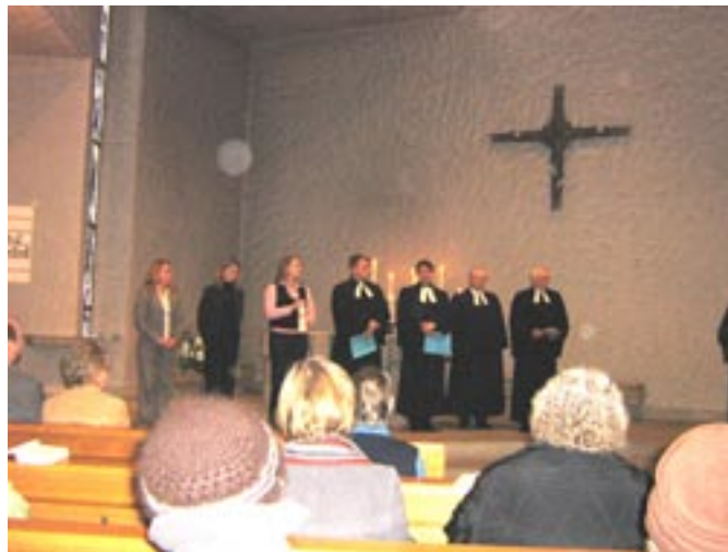
Gottesdienst am 21.1 in der St. Birgitta-Thomas-Kirche