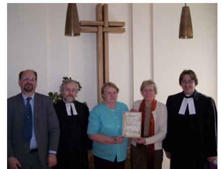
Die Partnerschaft zwischen der Kirchengemeinde Jurbarkas und der Thomas-Kirchengemeinde wurde in einem festlichen Gottesdienst in Jurbarkas im September 2006 vereinbart.

Auch den Helferinnen und Helfern, die beim Sammeln, Verpacken und beim Abtransport geholfen haben, möchte ich auf diesem Wege ganz herzlich danken. R. Wiele