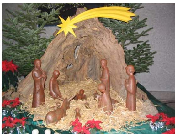
Krippe in der St. Birgitta-Thomas-Kirche