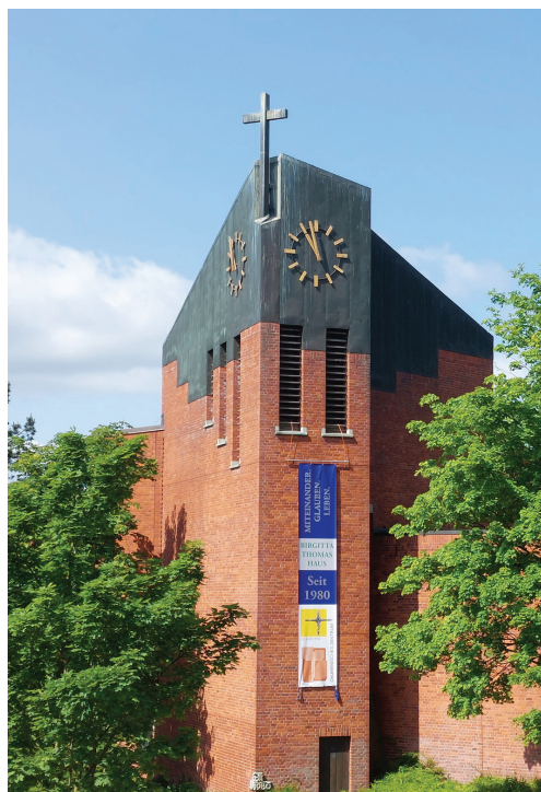
St. Birgitta-Thomas-Kirche Kiel-Mettenhof

Ökumenisches Zentrum Birgitta-Thomas-Haus St. Birgitta-Thomas-Kirche Skandinaviendamm 350 24109 Kiel-Mettenhof