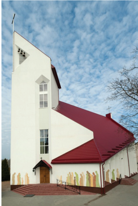
Kirche in Jurbarkas/Litauen